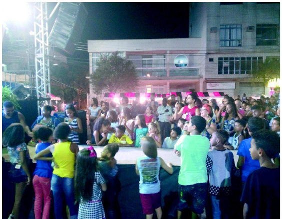
A população de Macuco foi para o centro da cidade assistir às apresentações culturais do município